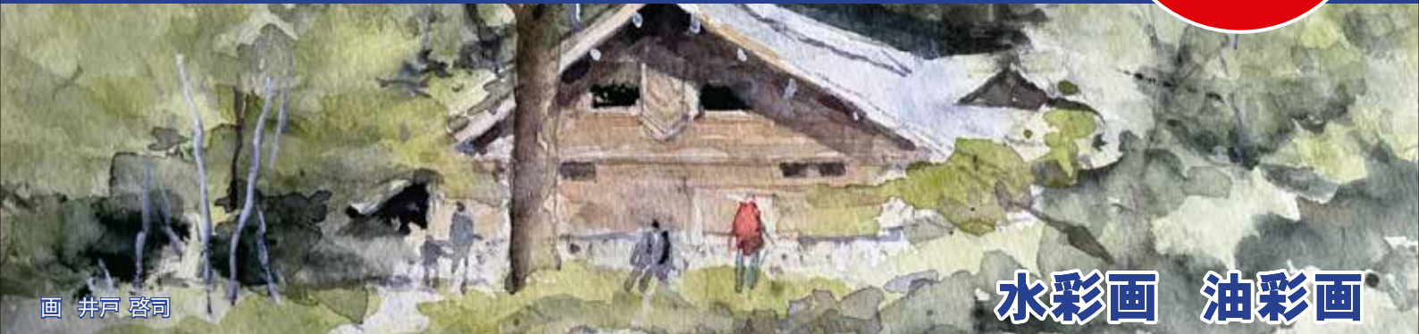
画 井戸 啓司